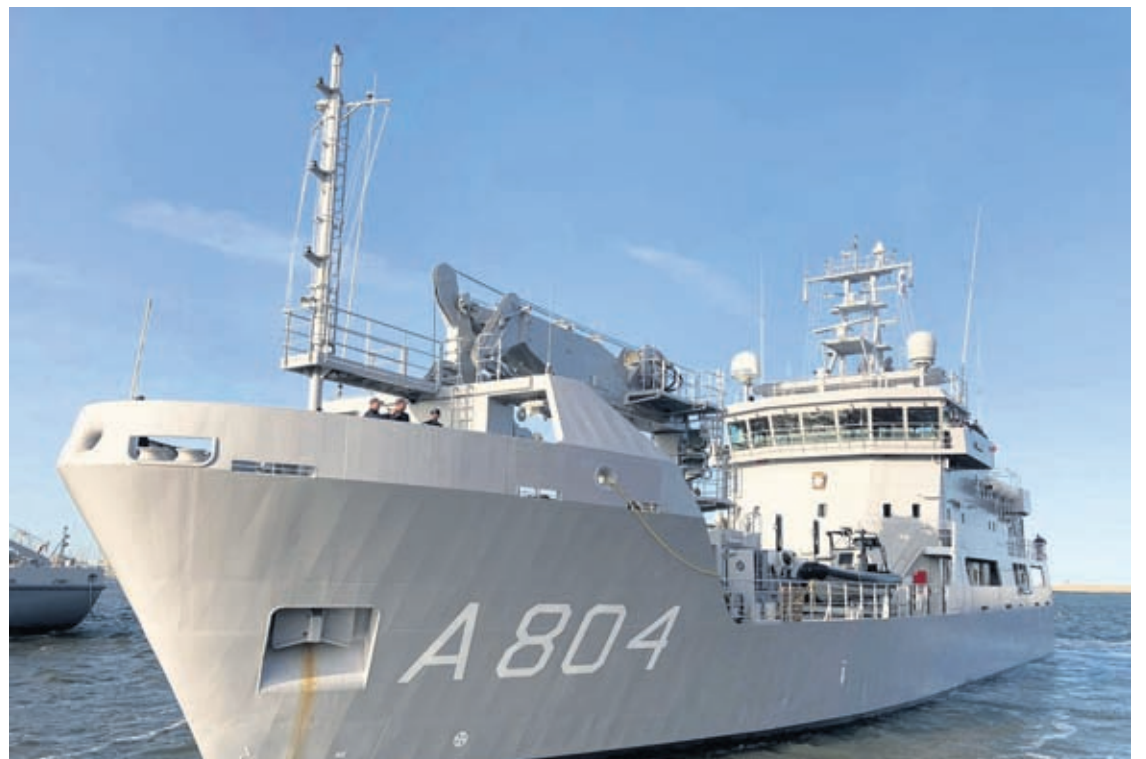
Mi no tin duda cu esaki lo logra sigur cu e actualisacionnan aki.”

Pelican mester sigui pa por lo menos 11 aña mas. E substituto di e barco ta keda construi na 2030, cu lo mester ta cla despues di un aña. “11 aña mas cu Pelican lo logra sigur.” Palabranan di Boom. “En principio un barco mester por nabega 25 pa 30 aña.